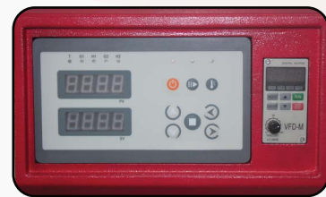
電子式溫控面板，操作更簡便。