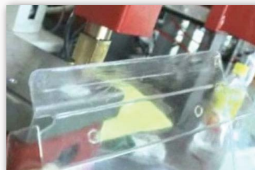
PET transparent box PET透明盒貼合效果