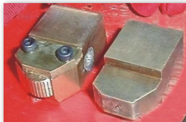
Nozzle tips for footwear and packing 適用於鞋業沿邊上膠及 PET透明盒貼合用的過膠嘴