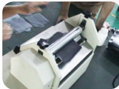
Roller Coating 滾輪過膠