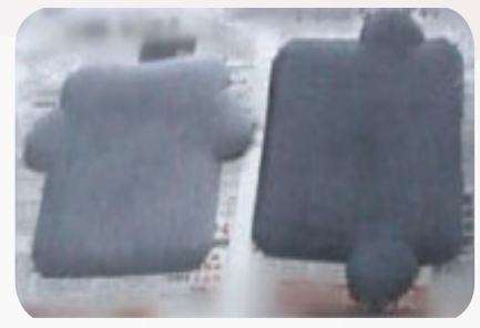
Uncoated & Coated 過膠前&過膠後

HWANG SUN ENTERPRISE CO., LTD. 皇尚企業股份有限公司