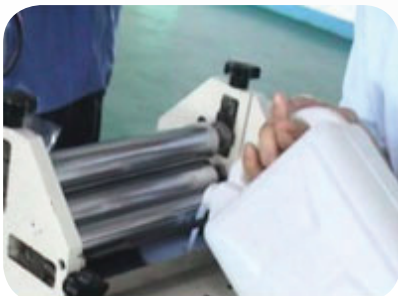
Load water-based adhesive 倒入水性膠